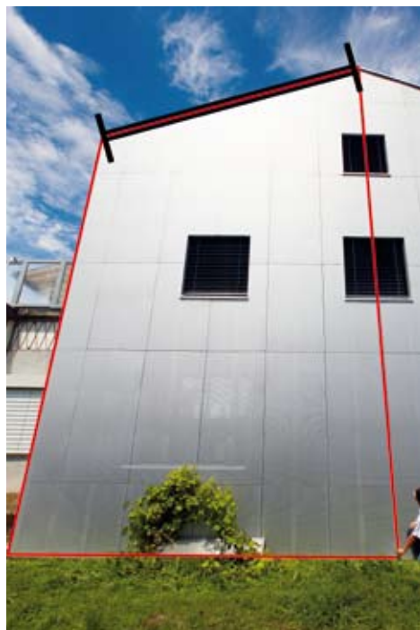
La funzione Trapezio facilita la misura dell'inclinazione dei tetti.