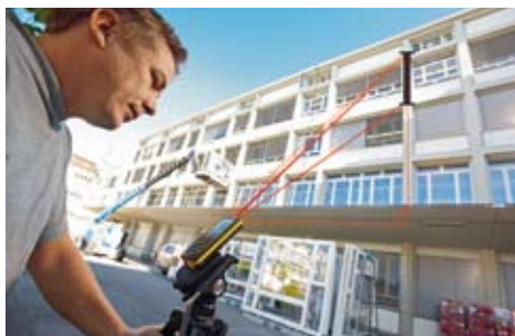
Misura indiretta dell'altezza: calcolo dell'altezza delle finestre con la funzione di Pitagora.