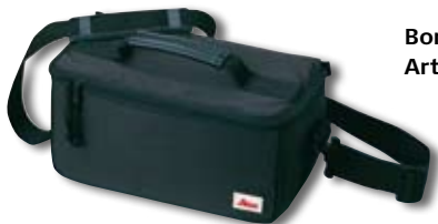
Borsa morbida nera Art.N° 667169