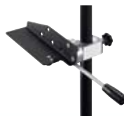
Supporto Leica DISTO™ per pala GPS Art.N° 769459