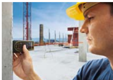
Misura di grandi distanze in esterno grazie alla Power Range Technology™ di Leica Geosystems.

Sono trascorsi più di 15 anni da quando Leica Geosystems ha rivoluzionato il mercato mondiale con il suo primo distanziometro laser portatile. Da allora l'azienda definisce gli standard di produttività nel settore della moderna metrologia. Un vivace spirito innovativo e una forte motivazione ispirano idee sempre nuove ai nostri sviluppatori. Il risultato sono prodotti con caratteristiche eccezionali di robustezza, affidabilità e precisione. Leica DISTO™ rende più leggere le giornate dei nostri clienti.