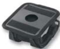
Supporto palmare per polso Art.N° 739200 Libertà di movimento durante il lavoro con Leica DISTO™ D8