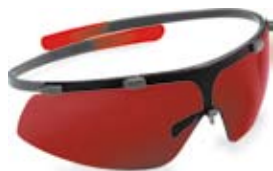
Occhiali per laser GLB30 Art.N° 780117 con 3 diverse lenti: occhiali per laser, occhiali protettivi e occhiali da sole