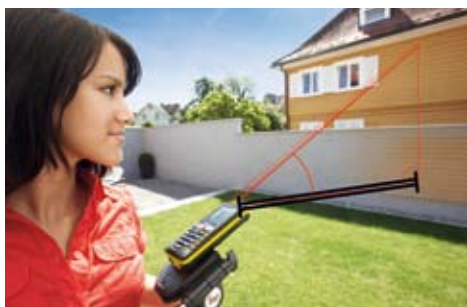
Le distanze orizzontali e le altezze possono essere misurate nonostante la presenza di ostacoli grazie al sensore di inclinazione.